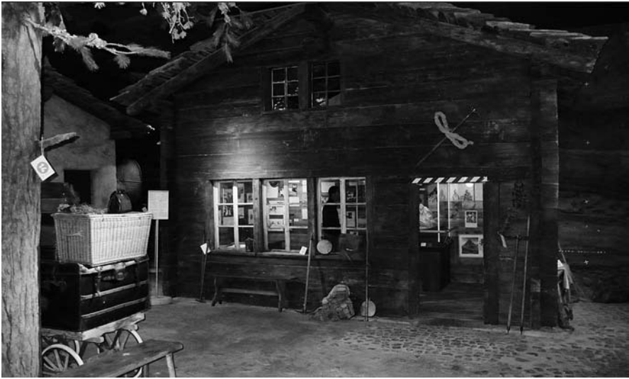
Abb. 2: Matterhorn Museum, Zermatt: der ehemalige Dorfplatz von Zermatt.

gelenkten Bergtourismus sind Neuorientierungen notwendig. Das Projekt Matterhornmuseum sowie die Neugestaltung des Gornergratgipfels sind Teil einer langfristig angelegten touristischen Neupositionierung, wie die Studie Leitbild «Zermatt 2015» zeigt. 22