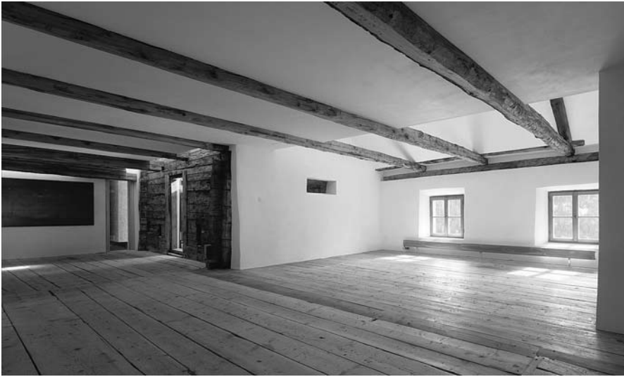
Abb. 1: Haus «Piz Tschütta», Vnà: Aufenthaltsraum und Gästezimmer im Obergeschoss

Die umfangreichen Aufgabenbereiche umfassten die Neugestaltung des touristischen Auftritts (unter anderem Corporate Identity, Corporate Architecture, Leitsystem ) zu entwickeln, die drei für Besucher geöffneten Schauhöhlen mit Attraktionen auszustatten, und die Stationsgebäude sowie das Museum auf der Schönbergalm neu zu gestalten. So beginnt seit Mai 2008 der Ausflug von Obertraun am Hallstätter See zur Mammut-Höhle und Riesen-Eishöhle auf der Schönbergalm beim gläsernen Kassengebäude (über das sich das Dachstein Welterbe-Logo zieht) und führt mit grosszügigen Panorama-Seilbahnen zur Station Schönbergalm (mit adaptiertem Kassenbereich und einer Wartezone mit Infotainmentwänden). Der Weg zu den jeweiligen Höhleneingängen ist mit einem markanten Leitsystem gekennzeichnet.