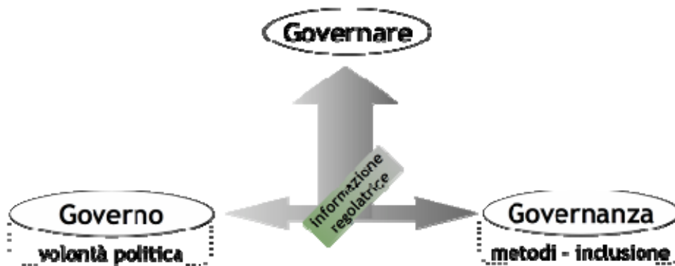
figura 2: Modello DISCUS della governance

Oggi da più parti si fa rilevare che proprio le questioni inerenti lo spazio (quindi le politiche urbane e della pianificazione del territorio) rappresentano il punto debole dello sviluppo sostenibile 4 . Una delle accuse rivolte all'approccio tradizionale della pianificazione del territorio è quella di non aver saputo dotarsi di strumenti (efficienti) di governo dello spazio urbano e regionale, lasciandosi sfuggire di mano i processi e i meccanismi della crescita incontrollata della città. Eppure non è da ieri che economisti, urbanisti, sociologi e geografi parlano mancanza e della necessità di questi strumenti, soprattutto per quanto riguarda le aree più densamente urbanizzate. Vediamo un esempio. Il modello di governance proposto dal progetto DISCUS distingue in maniera interessante l'obiettivo del governare ( governing ) dall'istituzione del governo ( government ) 5 . L'azione del governo in questo modello è tributaria delle procedure di governance ( governance ) e le risorse che attiva per il raggiungimento dei propri obiettivi.