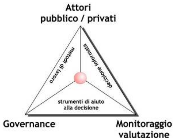
figura 4: La "governance" come metodo di lavoro