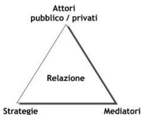
Figura3: Gli elementi della relazione

Ora se il significato dell'energia è abbastanza chiaro, ovvero una sorta di potenziale che permette di trasformare e/o di spostare la materia, quello di informazione è meno evidente. Per semplificare, possiamo dire che in un sistema territoriale (una città, un'area metropolitana, una regione, ecc.) ci sono due grandi "categorie" di informazione.