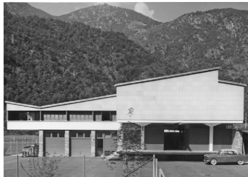
Rino Tami Deposito Avegno, 1955

La mostra restituisce la sintesi del lavoro svolto dall'area di Costruzione e Tecnologia dell'Accademia di architettura assieme a studentesse, studenti, architetti, ingegneri, proprietari degli edifici, nonché con l'aiuto fondamentale degli archivi privati e pubblici, cantonali, comunali e in particolare dell'Archivio Architetti Ticinesi e dell'Archivio del Moderno dell'USI.