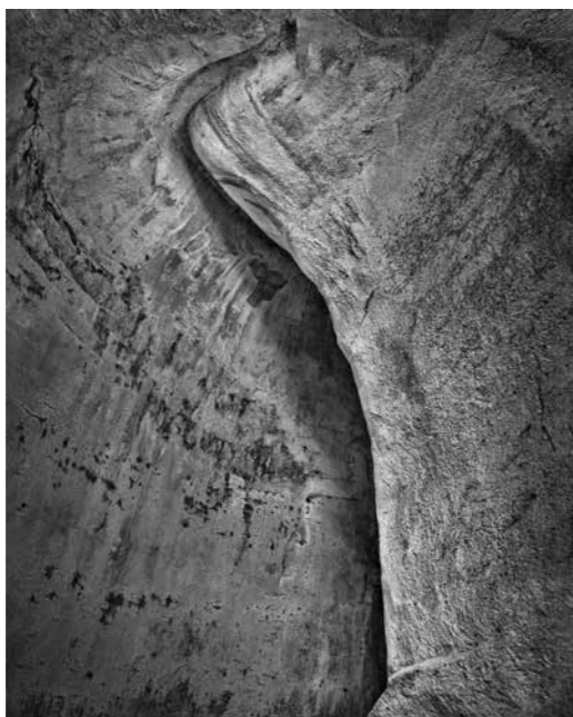
Dalla serie Metonimia / from the series Metonymy Architettura archetipale della terra attraversata dal fiume Sarno / Archetypal architecture of the land crossed by the Sarno River. Agro Sarnese-Nocerino, 2003