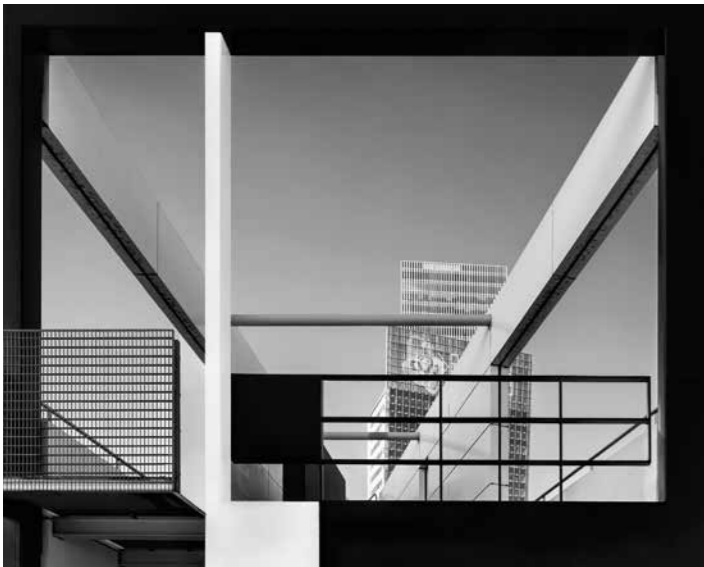
Dalla serie Transizione / from the series Transition Rotterdam, 2017